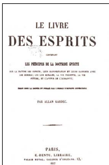
Contraportada de la primera edición, que vio la luz el 18 de abril de 1857, con 501 preguntas.

Realmente los Espíritus Superiores que tutelaron y dirigieron el advenimiento del Espiritismo, no se equivocaron al elegir a Denizard Rivail para aquella hercúlea tarea. Era la persona adecuada en el momento histórico preciso y, verdaderamente, realizó un trabajo excelente: “El Libro de los Espíritus” fue una dignísima tarjeta de presentación en sociedad de aquella, de esta, extraordinaria doctrina que es el Espiritismo. ☐